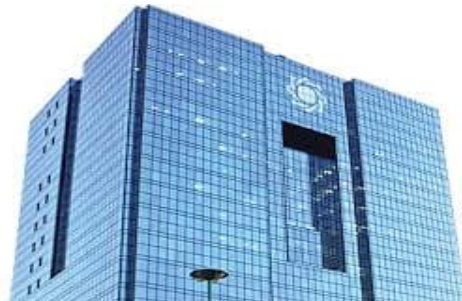
اداره کل امور مالیات استان چهارمحال و بختیاری